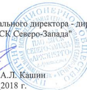
ГРАФИК ограничения режима потребления электрической мощности на 2018/2019 годы по филиалу ПАО "МРСК Северо-Запада" "Архэнерго" на территории Архангельской области